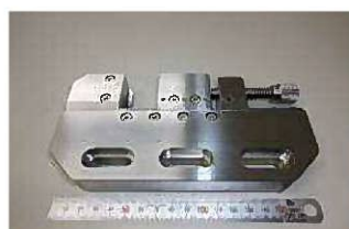
WIRE CUT VISE