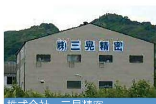
株式会社 三晃精密