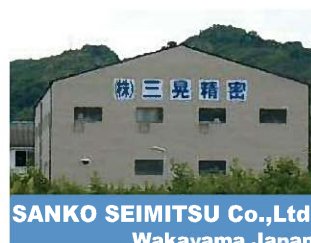
SANKO SEIMITSU Co.,Ltd. Wakayama Japan