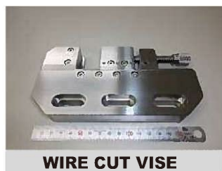
WIRE CUT VISE